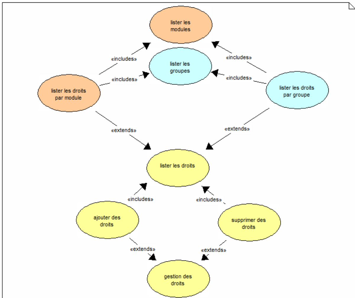
Diagramme de cas d'utilisation