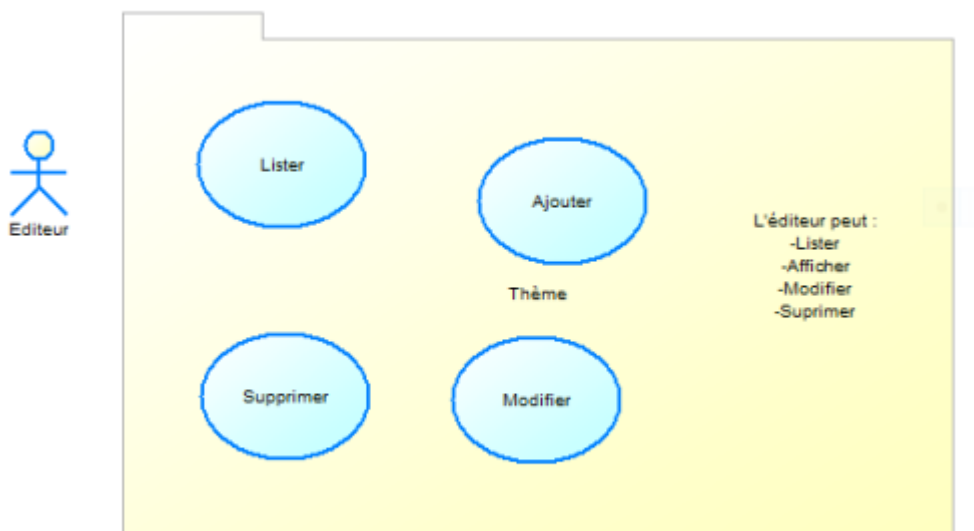
Diagramme de cas d'utilisation des thèmes