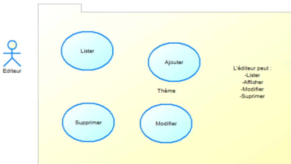
Diagramme de cas d'utilisation des thèmes