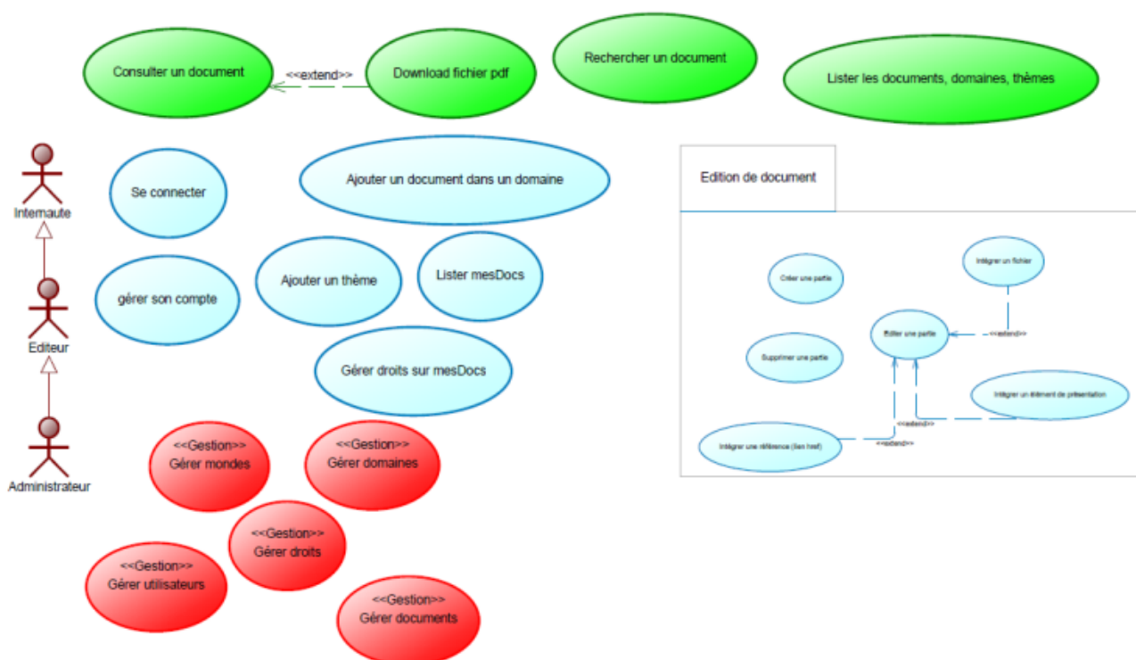
Diagramme de cas d'utilisation