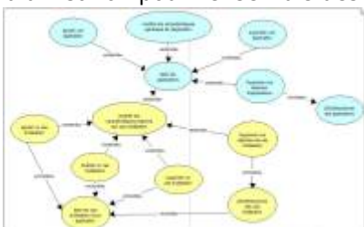
Diagramme des cas d'utilisation pour l'ensemble des fonctionnalités relatives à la gestion des applications et