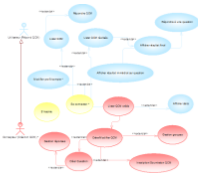
Diagramme de cas d'utilisation